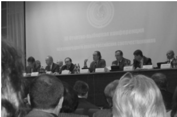
Начало работы конференции МСРС. 5 декабря 2008 г.

5-6 декабря в Москве в Библиотеке-фонде «Русское зарубежье» прошла III Отчётно-выборная конференция Международного совета российских соотечественников (МСРС). В её работе приняли участие делегаты от 114 (из 122) членских организаций МСРС из 48 стран мира. Были рассмотрены вопросы о деятельности этой международной организации за период с 2005 г., о выборах нового руководства Совета и стратегии дальнейшего развития. Накануне конференции – 4 декабря состоялось заседание Президиума МСРС. В ходе него были утверждены кандидатуры лауреатов Почётной награды «Соотечественник года» и итоги голосования по 11 организациям-кандидатам о приёме в члены МСРС.