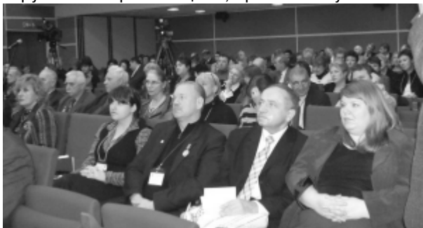
Делегаты конференции МСРС.