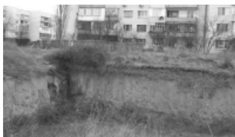
Тот самый котлован на улице Энгельса.