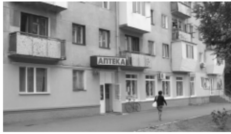
Та самая аптека на площади Мира.

Теперь под прицел «оптимизаторов» попала аптека на площади Мира. Первый этап конкурса по её продаже должен состояться 24 сентября. Обращают на себя внимание два момента. Во-первых, в опубликованных в прессе условиях конкурса записано: «дальнейшее использование объекта определяется покупателем». Таким образом, новый