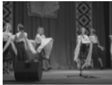
Праздничный концерт в разгаре.

И действительно, если бы не героизм русских солдат, то сегодня не только в Измаиле, но и по всей южной Европе в ходу была бы арабская вязь.