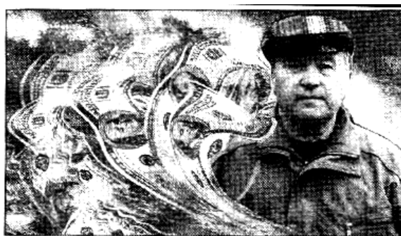
Коллаж из газеты «Измаильские ведомости» (23.04.1999 года).

Не дождётся! Горожане в большинстве своём не дураки. Им нет смысла идти на поводу у продажного политического пигмея и его случайных «попутчиков». К чему лишиться своих единственных защитников?! Да и сам «славянин»-«философ» в случае осуществления его мечтаний