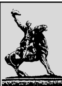
Измаилу 420 лет

Уважаемые земляки! Поздравляем вас Днём города! Желаем вам крепкого здоровья, счастья, мирного неба над головой, материального благополучия, успехов в работе и личной жизни, осуществления ваших надежд и планов!